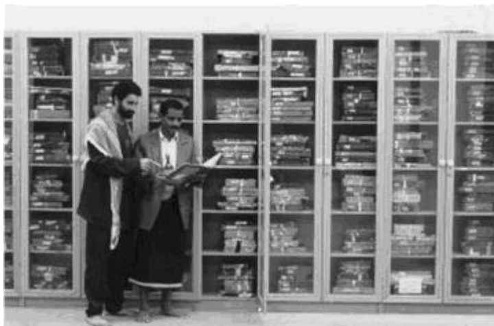
Perpustakaan Dar al-Makhtutat dimana disimpan Naskah-Naskah dan katalog yang baru ditemukan

Hingga saat ini, hanya ada tiga kopian kuno Qur'an yang ditemukan. Yang pertama disimpan di Perpustakaan Inggris di London, berasal dari akhir abad ke tujuh dan dianggap sebagai yang paling tua. Tetapi naskah-naskah Sana'a bahkan usianya lebih tua. Lebih dari itu, naskah-naskah ini ditulis dengan huruf yang aslinya berasal dari Hijaz – wilayah Arabia dimana Nabi Muhammad hidup, yang membuatnya tidak hanya sebagai naskah tertua yang berhasil selamat, tetapi kopian otentik Qur'an yang paling tua. Arabik Hijazi adalah tulisan (Mekkah atau Medinah), dan Qur'an mula-mula ditulis dengan huruf ini.