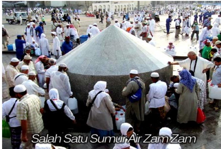
Jamaah Haji tengah mengambil air zam-zam di Mekah

alkohol. [4][5][6][7][8][9][10][11][12][13][14][15]. Daripada melarang untuk meminumnya, [1] bukankah sebaiknya Allah hanya melarang kita untuk menyalahgunakannya?