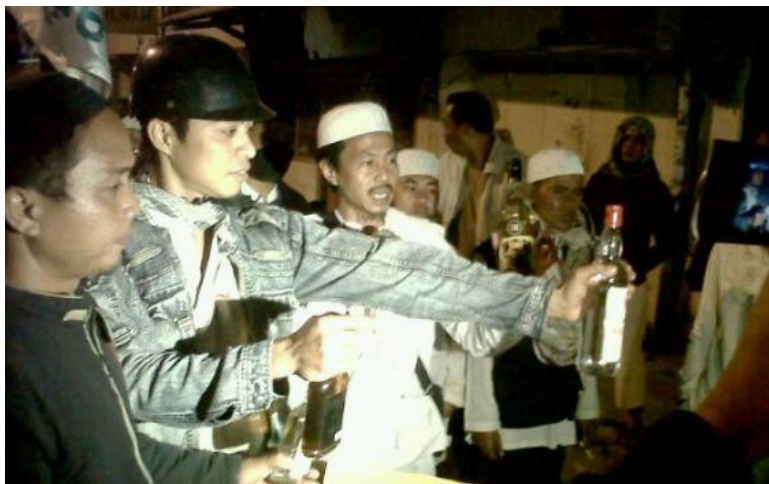
Massa FPI Makassar - sedang menggerebek toko penjual miras

Saya ex-Muslim. Kini bersyukur karena mendapat pencerahan setelah bergumul diri untuk menyidik 1001 isu-isu Islamik yang terus menerus mengganggu nurani dan akal sehat saya. Inilah sebagian daftar pertanyaan-pertanyaan yang layak untuk diper-tanyakan kepada setiap teman Muslim. Kita lakukan itu secara serial.